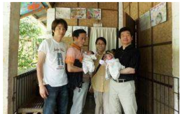
生まれたばかりの赤ちゃんを抱かせてもらいました