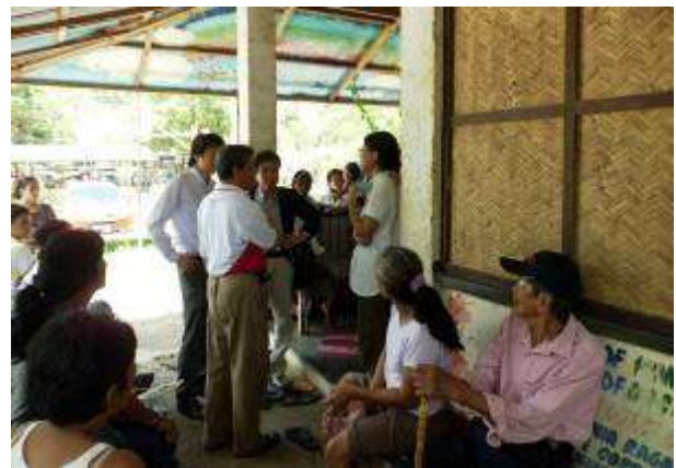
クリニックの中の様子

今回は現地のこのような現状を認識でき、改めて支援の必要性を感じた次第であります。