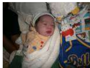
生まれたばかりの赤ちゃんです