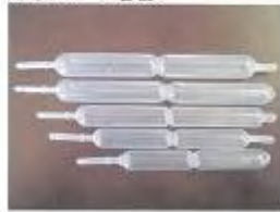
ポリジュース容器