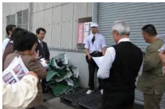
工場長より説明を受けます