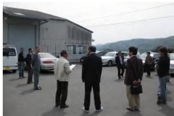
事務所の前の駐車場に集合