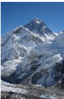
（エベレスト） サガルマタ