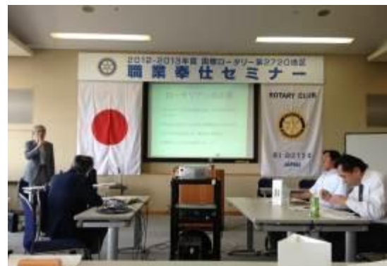
石部会長、白杵幹事が出席

2013年5月25日(土) 13:30～16:30 グランメッセ熊本 2F「大会議室」