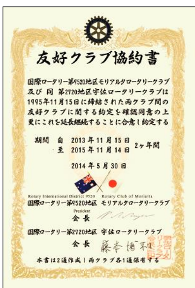
モリアルタRCからの記念品